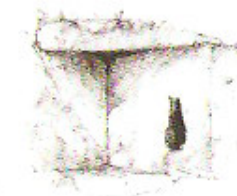
Exemple de meurtrière située à l'entrée du manoir

La façade de la maison d'habitation est du XVII e siècle. Cependant, l'étude de la généalogie des seigneurs d'Aumeville et des éléments archéologiques (ouvertures et tours d'escalier en vis), nous laisse penser que la construction de cet édifice s'est échelonnée du XII e au XVII e siècle.