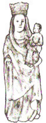
Vierge du XII e siècle

L'église d'Aumeville-Lestre est située entre deux presbytères et à proximité d'un château. Cet édifice du XVI e siècle abrite deux oeuvres classées, une vierge à l'enfant (XVI e siècle) à l'intérieur et un retable de Saint Pierre (XV e siècle) enclavé dans le mur extérieur. Par ailleurs, le portail de cet édifice est surmonté d'une tête sculptée attribuée à Saint Gilles.