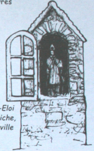
Statue de Saint-Eloi dans une niche, à Gonnevill

Elle est dédiée à Saint-Eloi, évêque de Noyon au VII e siècle et principal ministre du roi Dagobert. Saint-Eloi passa les vingt dernières années de sa vie à se dévouer aux pauvres